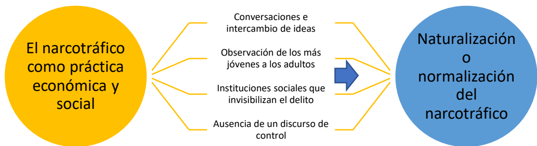
Proceso de naturalización o normalización de una práctica cultural